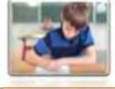
Un élève طالب